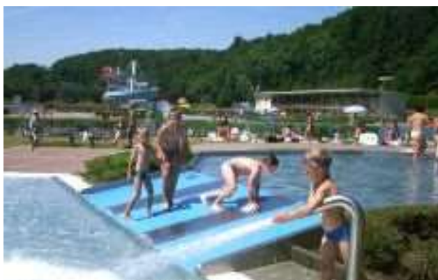
FREIBAD METTLACH in Richtung Losheim

Die Voraussetzungen für Tischtennislehrgänge sind gut: nur 8 km zwischen Jugendherberge und Trainingshalle.. Die Halle ist mit einem Schwingboden ausgestattet und bietet Platz für 13 Tische. In einer Entfernung von 3 km ist das Mettlacher Freibad zu finden. Zwischen Jugendherberge und Trainingsort wird ein Fahrdienst organisiert.